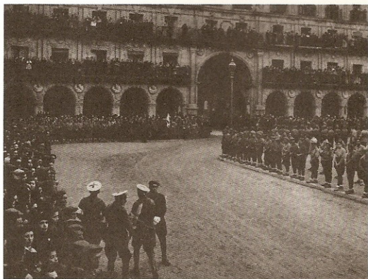
La Plaza Mayor de Salamanca durante la presentación de credenciales del Embajador Cantalupo.