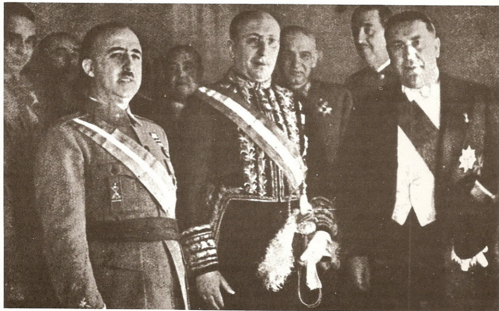
Cantalupo, primer Embajador de Italia, tras la presentación de credenciales en marzo de 1937. A su izquierda, el diplomático español Sangróniz.