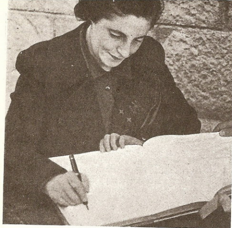
Pilar Primo de Rivera.