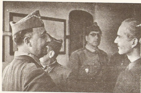
Don Ramón Serrano Suñer con Franco a bordo del "Júpiter", en la primavera de 1938.