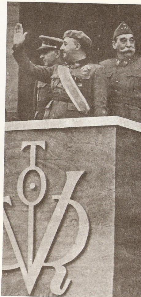
Franco, brazo en alto, preside el Desfile de la Victoria.