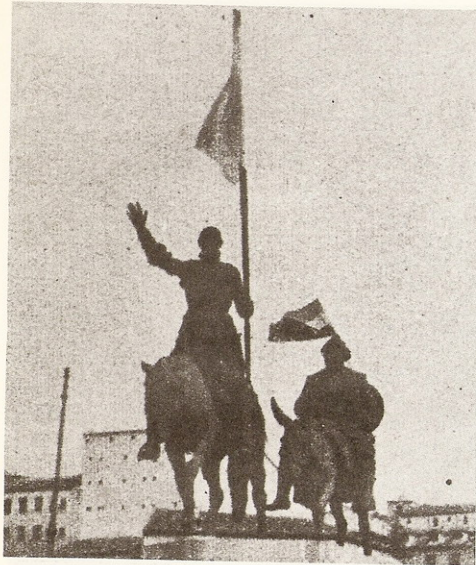
El monumento a Cervantes en la Plaza de España madrileña, engalanado con banderas rojigualdas.