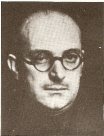
Don José Ibáñez Martín, Ministro de Educación Nacional.