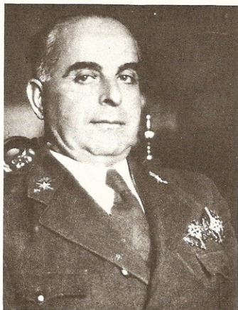
Teniente General don José Enrique Varela Iglesias, Ministro del Ejército.