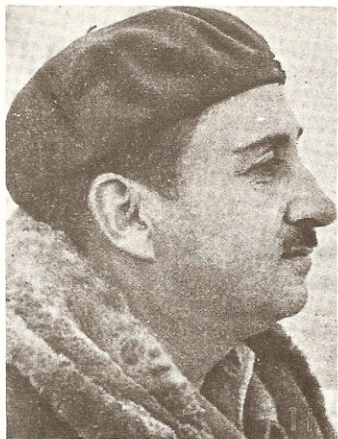
Teniente Coronel don Luis Alarcón de la Lastra, Ministro de Industria y Comercio.