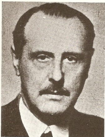
Don Esteban Bilbao Eguía, Ministro de Justicia.