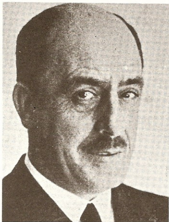
Almirante don Salvador Moreno Fernández, Ministro de Marina.