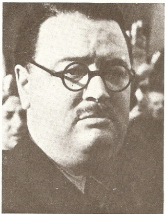
Don José Larraz López, Ministro de Hacienda.