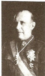
Excmo. Sr. D. Francisco Gómez Jordana y Sainza, Ministro de Asuntos Exteriores