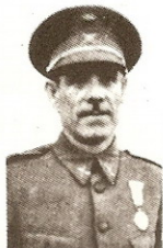
El nuevo Ministro del Ejército, general Asensio Caballero