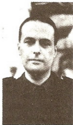
Camarada Luis López Fontán, Ministro de la Gobernación