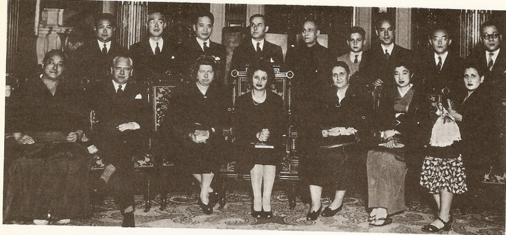
Don Ramón Serrano Suñer y su esposa en la Embajada japonesa en Madrid.

FUNDADORES: DON CARLOS Y DON BARTOLOMÉ GODÓ