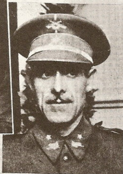
General don Carlos Asensio Ca- banillas, ministro del Ejército. →