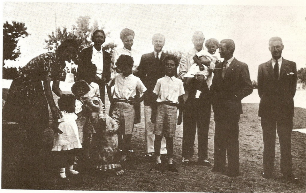
Unos días de descanso en La Granja. Rodean a don Ramón Serrano Suñer familiares y amigos.