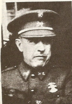
General don Francisco Gómez-Jordana, ministro de Asuntos Exteriores