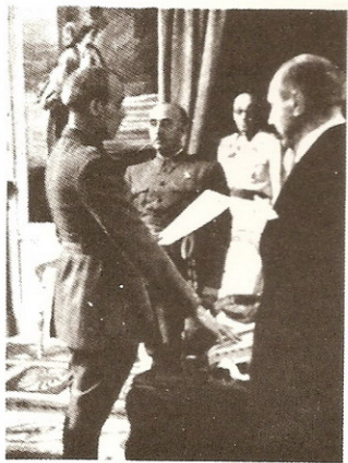
El nuevo Ministro del Ejército, general Asensio, prestando juramento