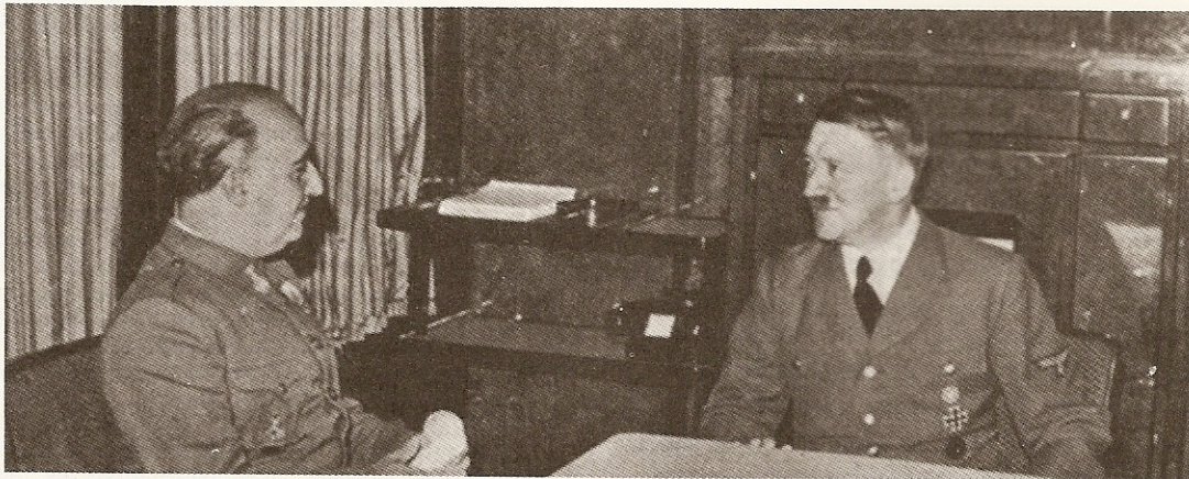
Conversación con Hitler en Hendaya.